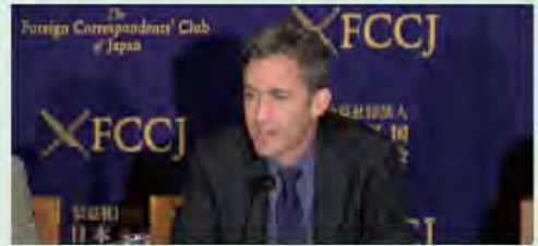
記者会見する国連特別報告者デービッド・ケイ氏

国連の「意見及び表現の自由」の調査を担当する特別報告者、デービッド・ケイ氏(米カリフォルニア大教授)が6月2日、記者会見した。「メディアの独立性が大きな脅威にさらされている」と懸念を示したほか、政府が放送免許を取り消せる点などを問題視した。