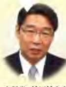
文科省・前川前次官