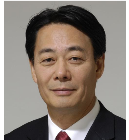
民主党代表 海江田万里